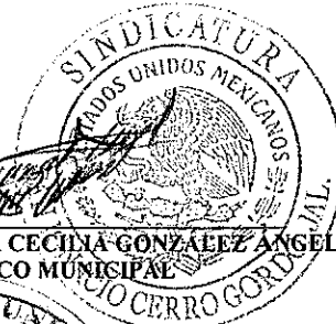
LIC. BLANCA CECILIA GONZALEZ ANGEL SÍNDICO MUNICIPAL